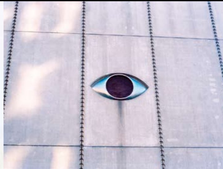
Svenska filminstitutet, stillbild: Jan Göransson, SFI