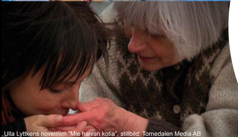
Ulla Lyttkens novellfilm "Mie halvan kotia", stillbild: Tornedalen Media AB