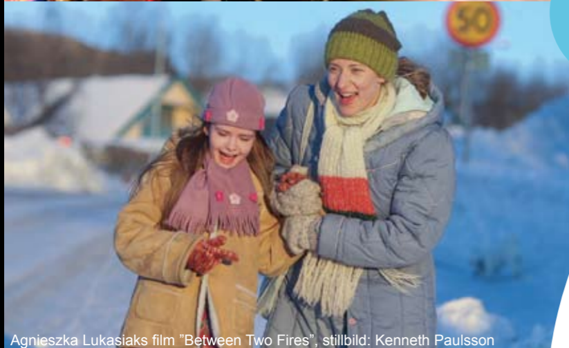
Agnieszka Lukasiaks film "Between Two Fires"