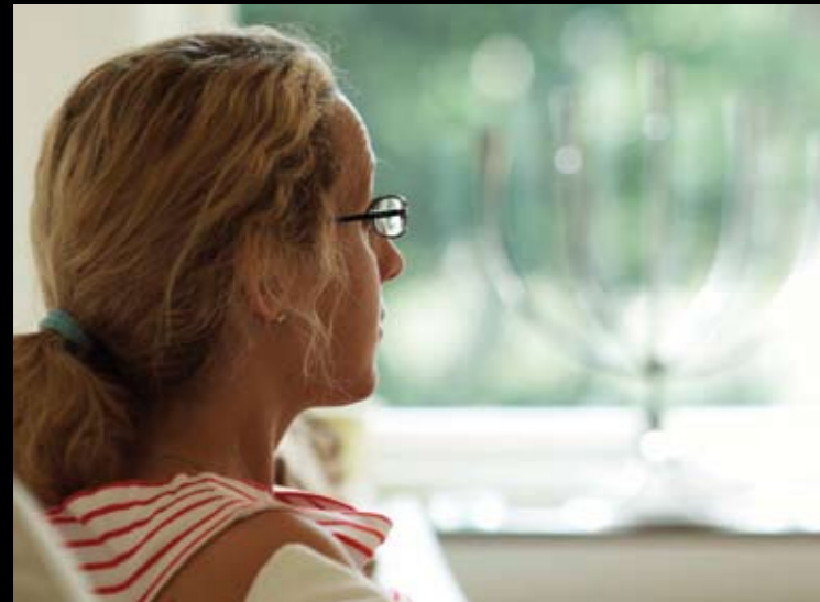
Ingela Lekfalks dokumentärfilm "Hur kunde hon", stillbild: Anders Bohman

Med reservation för ändringar i programmet