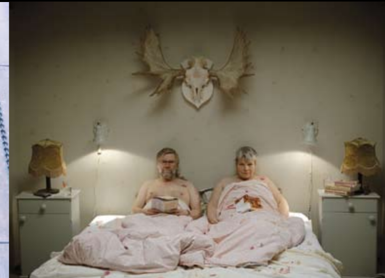
Patrik Eklunds kortfilm "Slitage", stillbild: Rolf Carlborn