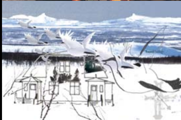
Liselotte Wajstedts dokumentär "Kiruna – Rymdvägen 1", kollage Liselotte Wajstedt