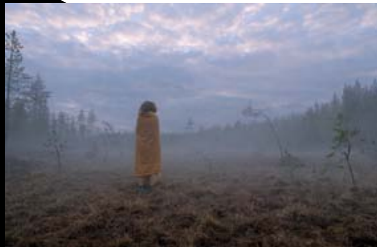
Jonas Selberg Augustséns kortfilm "Myrlandet", foto Bokomotiv Filmproduktion AB

Med reservation för ändringar i programmet