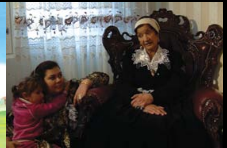
Birgitta Lindströms dokumentär "Mormor, jag och Désiree"