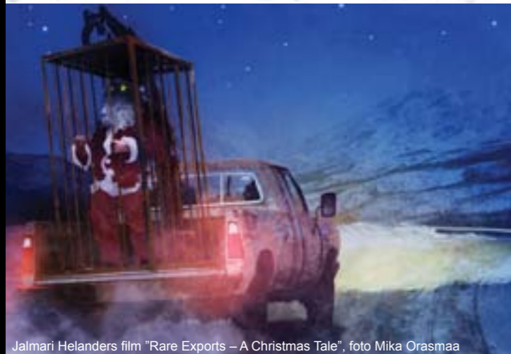
Jalmari Helanders film "Rare Exports – A Christmas Tale", foto Mika Orasmaa