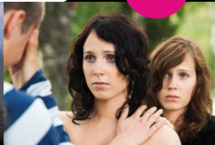
Anders Grönros film "Jag saknar dig"